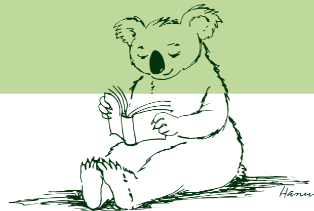
Koliro, der literarische Koala.

Wir lieben Koalas und wollen sie schützen, wie wir auch mittelständische Buchläden schützen. Deshalb werden wir ab Frühjahr 2016 mithelfen, bedrohte Koalas zu unterstützen. Koliro ist Pate des Koala-Jungen Irwin im Zoo Duisburg.